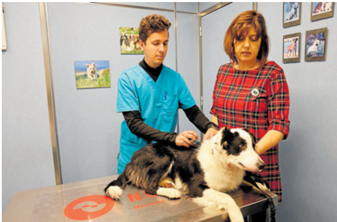
Un perro es vacunado en la consulta de un veterinario en una imagen de archivo.

El Colegio Oficial de Veterinarios de Badajoz (Icovba) considera la medida una «barbaridad fuera de lugar». De hecho, cuando se abrió el periodo de consulta pública, el organismo colegial ya manifestó de forma clara su oposición, al entender que eliminar la obligación de revacunar a los canes cada año irá en detrimento del control de la enfermedad. «La gente estaba acos-