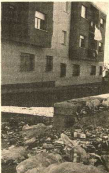
En la parte superior y detrás de los edificios se contempla este «basurero» improvisado

en el aire, pero queremos repetírsela a la autoridad correspondiente. El Ayuntamiento, sin duda, tendrá una respuesta a la pregunta. Aunque no es lógico que tras dos meses de haber sido entregadas unas viviendas no se haya establecido un servicio regular de recogida de basuras y se haya dado entrada a la luz pública.