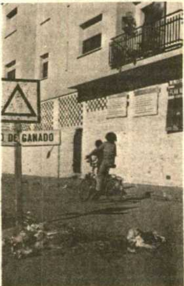
En la misma entrada, junto a la carretera de Campomayor, este montón de basuras

HOY, comentaba el mal estado, o si se quiere la suciedad que rodeaba e impregnaba las pocas calles que constituyen el nuevo complejo de viviendas Campomayor. La basura se amontona, no exageramos (los vecinos son testigos, parciales y enfadados si se quiere, pero testigos) en las calles y entre los