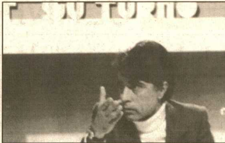
Jesús Hermida, caso único de incombustibilidad. Foto de sus inicios.

En la nómina de TVE existen un buen número de locutoras y locutores, caras conocidas en su día, que hoy sigue en un "activo" dudoso. El Ente Público cuenta con una plantilla cercana a 150 locutores, cuyas caras son anónimas o se imaginan borrosas mientras leen en "off" el texto asignado.