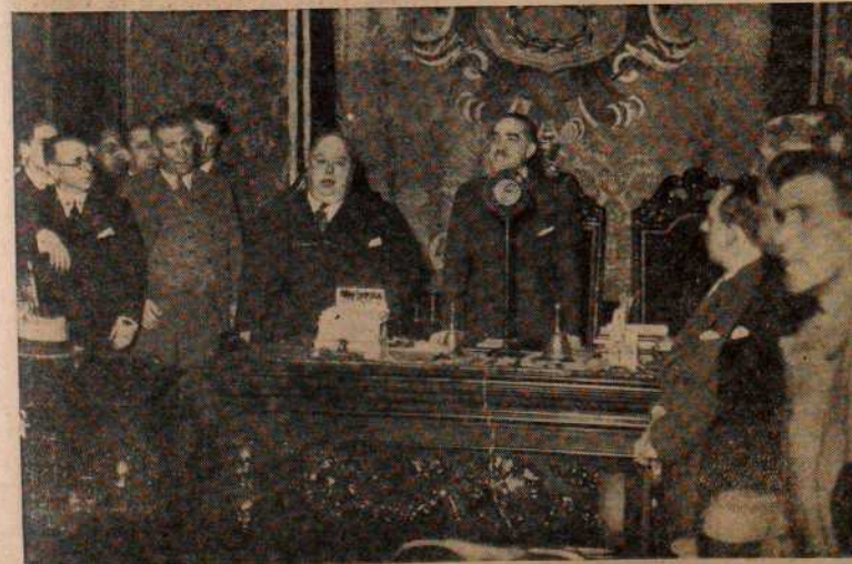
MADRID.—El ministro de la Gobernación durante el acto de la entrega de la alcaldía de Madrid al señor Rico.