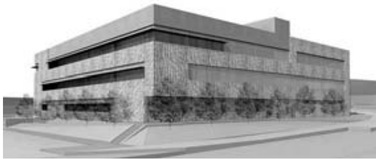
Simulación del edificio incluida en la memoria del proyecto.

ciento restante. El convenio también estipulaba que el Ministerio concedería un préstamo a favor de la Uex por ese 30 por ciento (6,5 millones de euros).