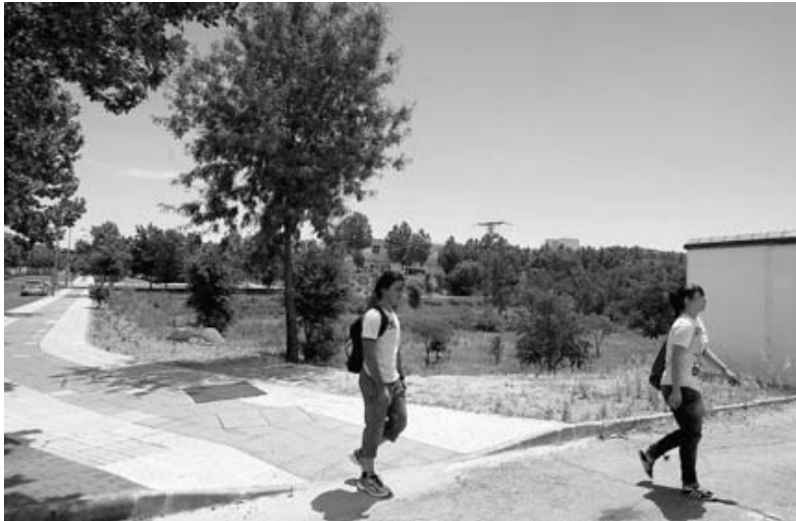
Parcela donde se construirá el edificio, situada frente a las piscinas de verano del campus.

La puesta en marcha de este edificio es fruto de un acuerdo suscrito en 2010 entre el Ministerio de Ciencia e Innovación, la Consejería de Economía y Comercio y la Universidad de Extremadura por un importe total de 21 millones de euros. Estos fondos estaban destinados a la creación de dos edificios para los institutos universitarios de investigación en los campus de Cáceres y Badajoz. Según el convenio, el Ministerio se encargaría de anticipar a la Universidad un 70 por ciento del total, correspondiente a la cofinanciación del Feder (fondos europeos). Y la Consejería de Economía tendría que aportar el 30 por