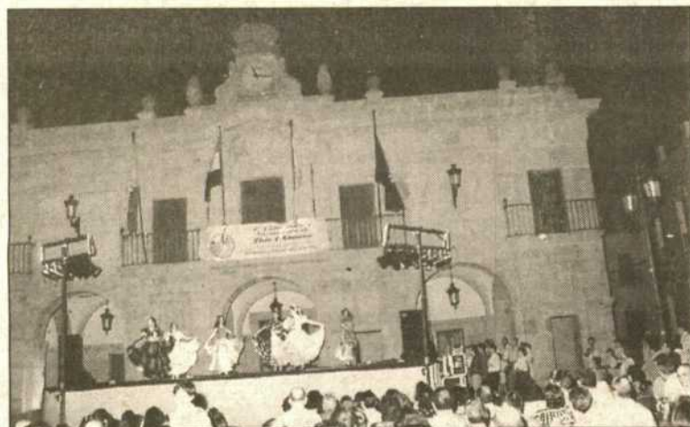
Imagen de una celebración de este Verano Cultural.