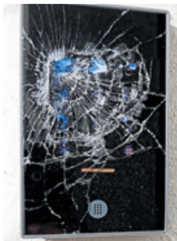
Sistema de acceso roto. APTUEX

tigamiento contra un sector que trabaja dentro de la legalidad, genera empleo y dinamiza la economía local».