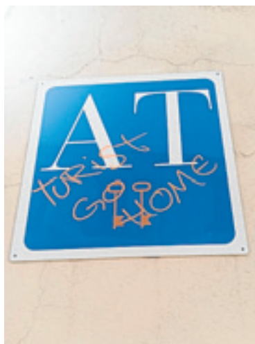
Pintada contra el turismo. APTUEX