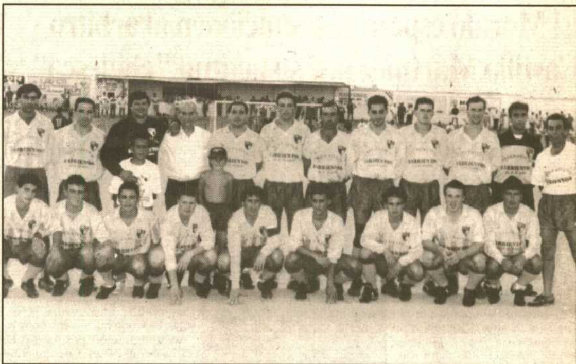
La S.P. Villafranca atraviesa un buen momento de juego y espera frenar al líder