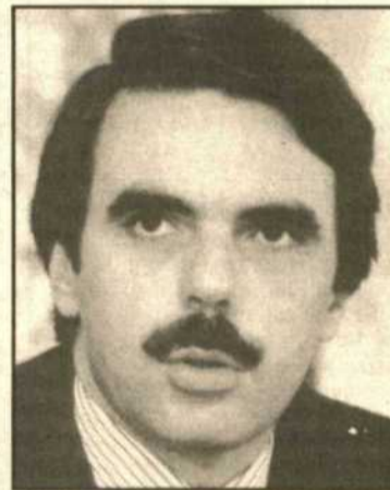
José María Aznar.

El PP ha denunciado la existencia de micrófonos en varios despachos de su sede central de Madrid. Al parecer, el PP encarga