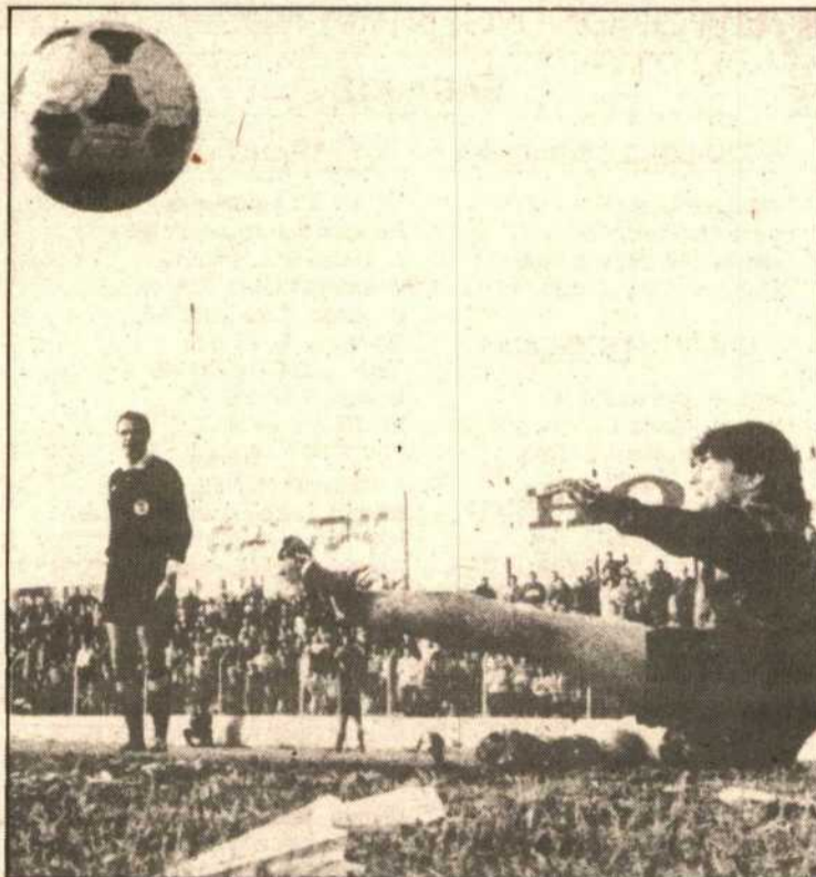
De esta forma logró el Badajoz la victoria, con el gol del penalti.

■ Valioso positivo del Mérida en Sanlúcar