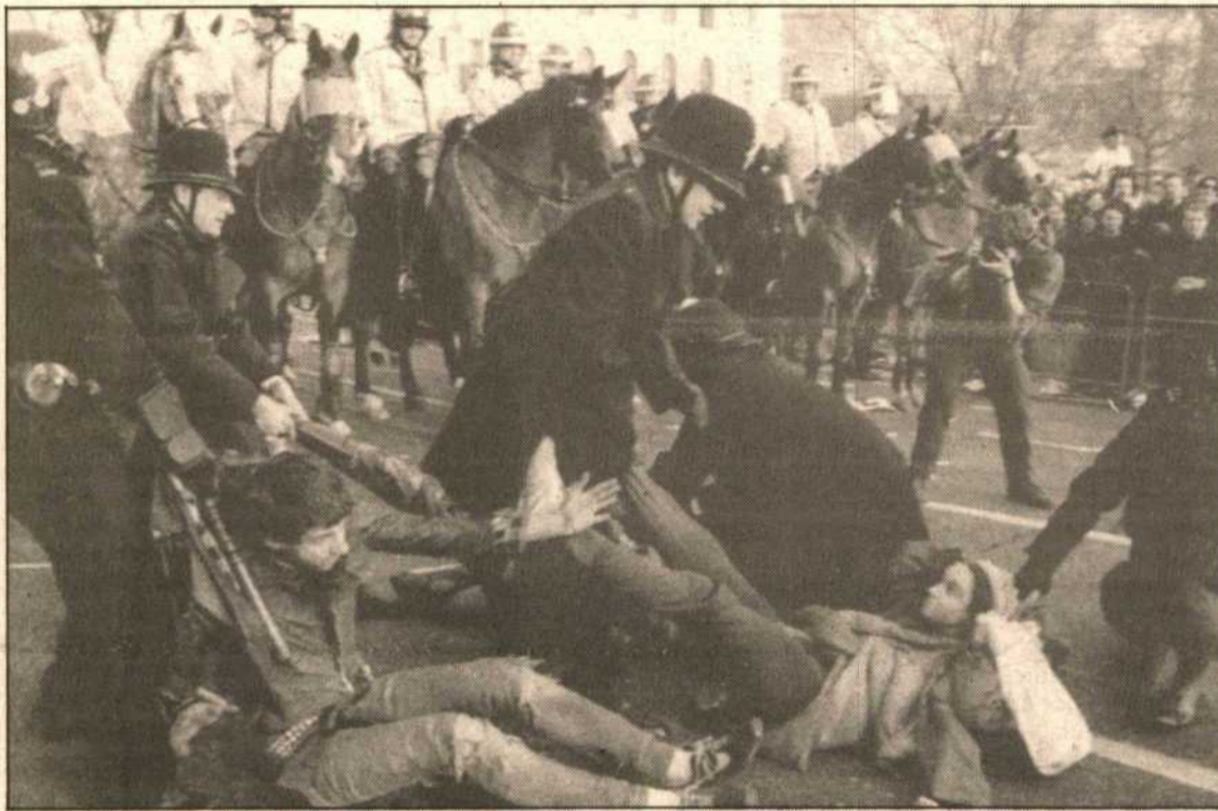
Los manifestantes mantuvieron, en algunas zonas, una auténtica batalla campal con la Policía.