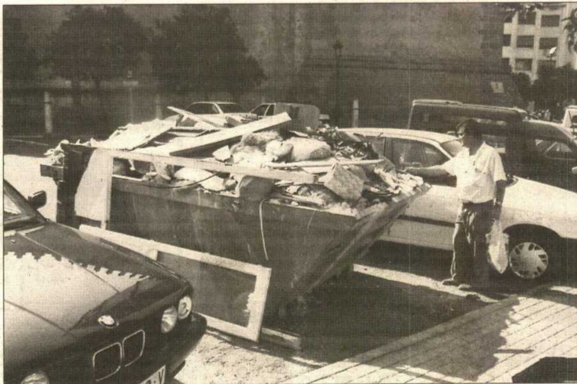
El contenedor repleto contrasta notablemente con los valores monumentales de la Plaza de España

La Plaza sigue siendo lugar obligado de paso para muchos ciudadanos y vehículos y esa masiva utilización pasa una factura que está pendiente.