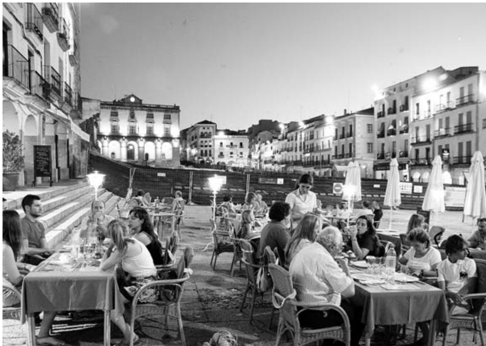
Imagen de las terrazas de la Plaza Mayor, que no es de las zonas más caras de la ciudad para instalar un velador.

Eso sí, viernes, sábados y vísperas de festivos, la normativa permite prolongar el horario media hora más.