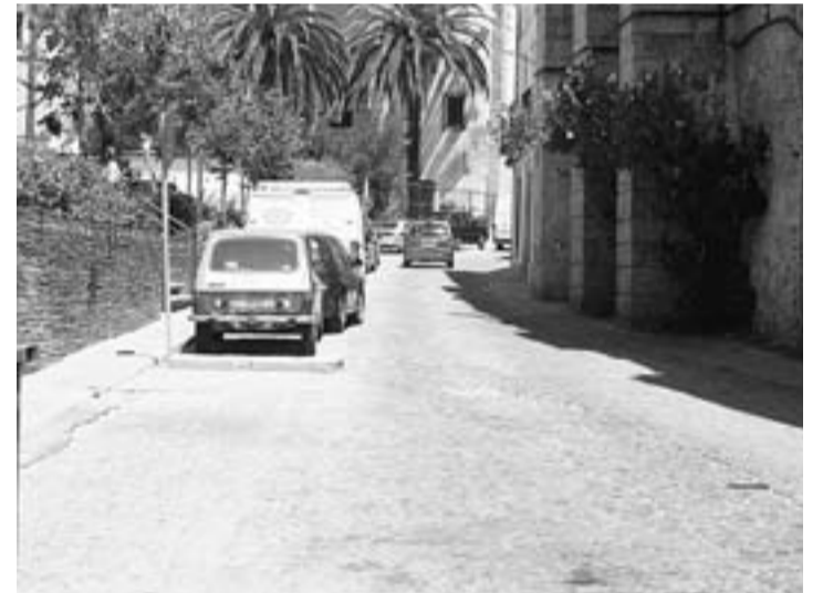
En la calle de Los Pardos se acometerán estas obras. / L. C. G.

El próximo año, se llevará a cabo un Plan Provincial de Obras, en cuya convocatoria se incluirá la remodelación de algunas calles de la pedanía trujillana de San Clemente.