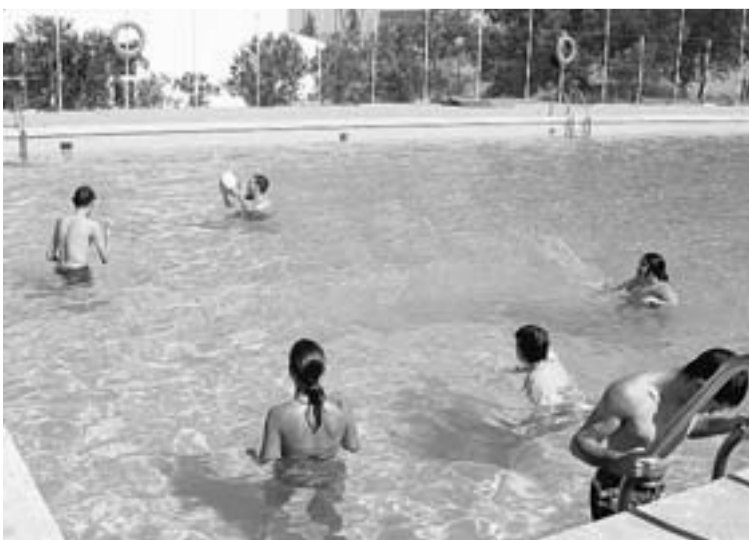
Las instalaciones de la piscina dificultan la accesibilidad.

No obstante destaca que el resto de las viviendas son accesibles tanto para el aseo personal de los jóvenes como para la convivencia diaria.