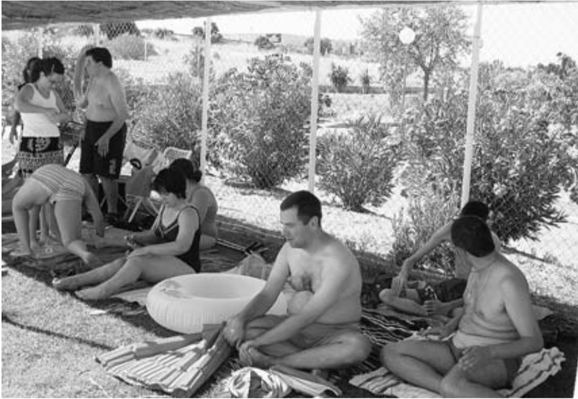
La Junta de Extremadura promueve este encuentro en la ciudad desde hace cuatro años. / L. C. G.