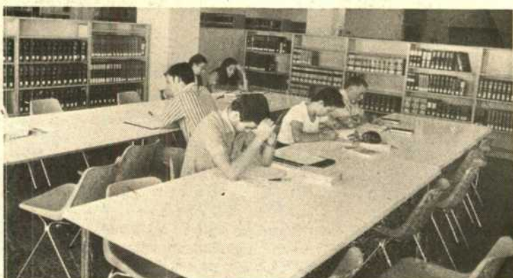
En la región hay bibliotecas con 400 metros cuadrados y otras con solamente 20