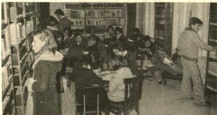
Biblioteca de Alcántara que cuenta con 3.486 volúmenes para una población de 2.551 personas. El presupuesto anual es de 114.412 pesetas