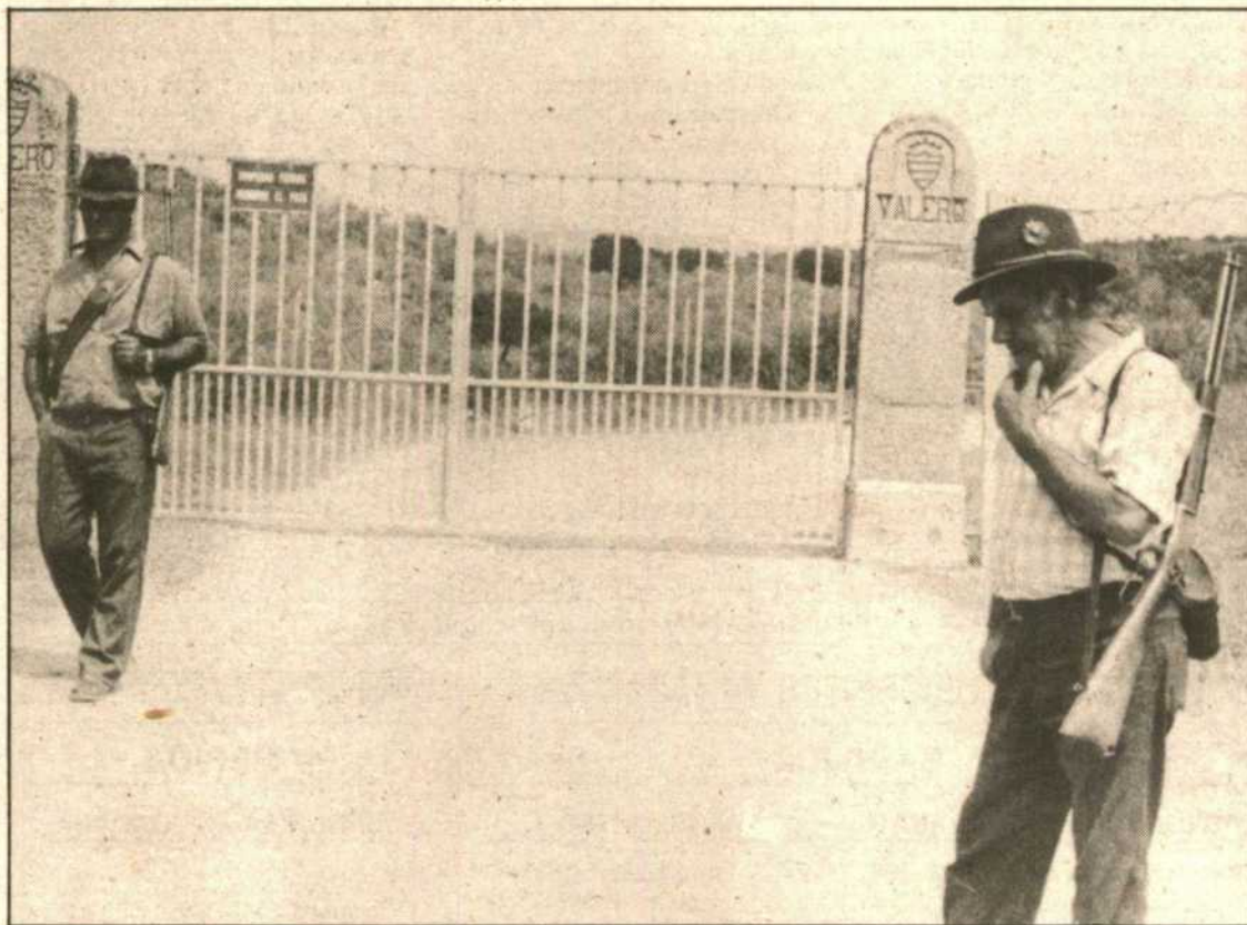
Entrada a la finca Valero. (ARCHIVO)