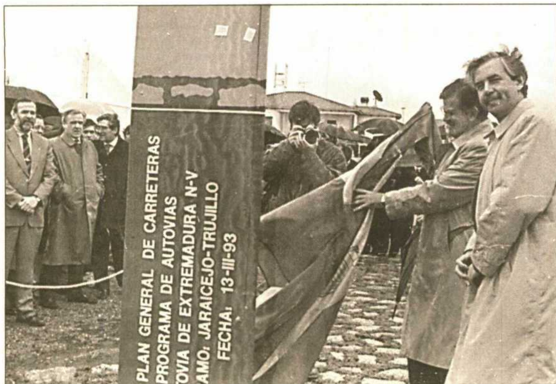
Un momento de la inauguración del nuevo tramo de la Autovía de Extremadura, de Jaraicejo a Trujillo, que suponen 16 kilómetros. (MUNEZ).