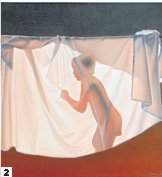
1. Museo Pedrilla. 2. Niño jugando a la Luz, de Jaime de Jaraíz.