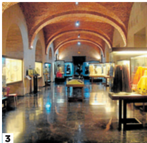
3. Museo Textil de Plasencia. 4. Sala de arte El Brocense.