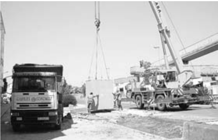
Trabajadores instalando los cubículos de la calle Cartagena.

visto, en pocos días llegará el material que falta y en solo unos días quedarían ubicados los últimos. Dos millones de euros Cabe recordar que el ambicioso proyecto supondrá una inversión superior a los dos millones de euros, provenientes del contrato del servicio de basuras con Urbaser. Se crearán 80 puntos de recogida que sumarán más de 200 contenedores de residuos orgánicos, envases, vidrios y papel y cartón. Cada uno de estos puntos ha supuesto una inversión media de 26.000 euros aproximadamente.