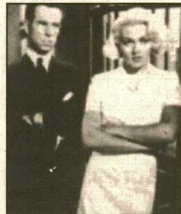
Hume Cronyn y Lana Turner.

Por lo menos tres versiones oficiales y algunas más oficiosas se han realizado en el cine, tomando como base la célebre novela de Jame M. Cain "El cartero siempre llama dos veces". La que hoy emite el espacio "Cine Paraíso" está considerada la mejor de las que adaptaron literalmente el texto del gran escritor de la serie negra. "El cartero siempre llama dos veces", versión Garnett, se estructura a modo de "flash-back". Frank, el protagonista de la película, ha sido condenado a muerte por el asesinato de su amante Cora.