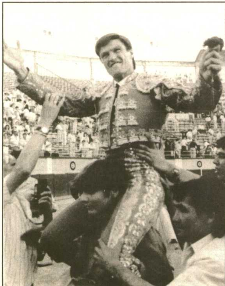
Otro triunfo de Espartaco. (SANTI RODRIGUEZ)