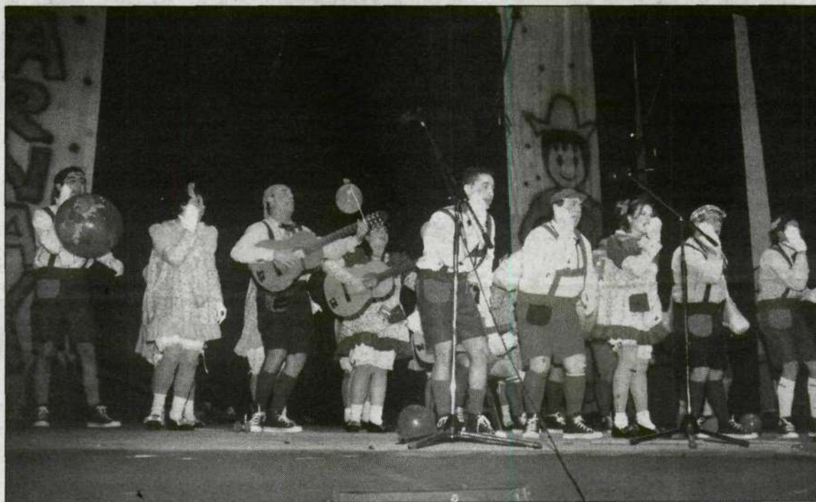
Un gesto muy expresivo en la actuación de una de las charangas.

Pero en el pueblo no todos son forofos de la bruja, porque 'Las nietas de la viejas del año pasado' afirmaban que "en este pueblo hicieron tonterías, vinieron brujas, hicieron brujerías, aseguraron que pronto llovería y siempre