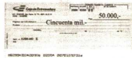
6 premios de 250.000 Ptas. repartidas en 5 pagas extraordinarias.