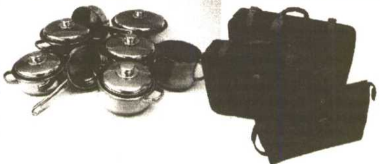
50 Juegos de MALETAS