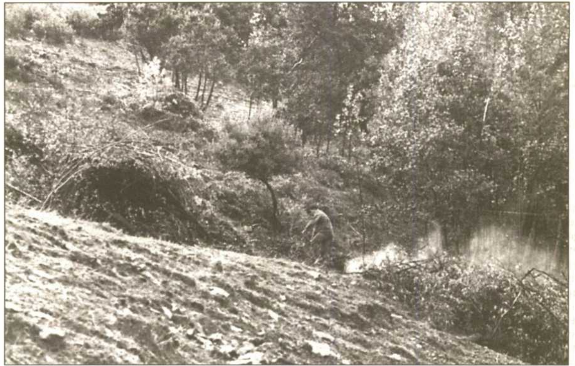
Los ecologistas consideran que el Ayuntamiento de Navalvillar de Ibor ha realizado un ensanche de caminos de manera irregular. En la imagen, dehesa "Valle de Ibor"

de dos meses la cantidad de 150.000 pesetas en concepto de multa. La CEPA considera necesaria la construcción de una depuradora de aguas residuales así como el sellado del basurero y la entrada de Torrejón en el Plan de Residuos de la Junta, que tiene un centro de tratamiento en Galisteo, donde podrían llevarse esos residuos que ahora contaminan el arroyo y el río Tajo.