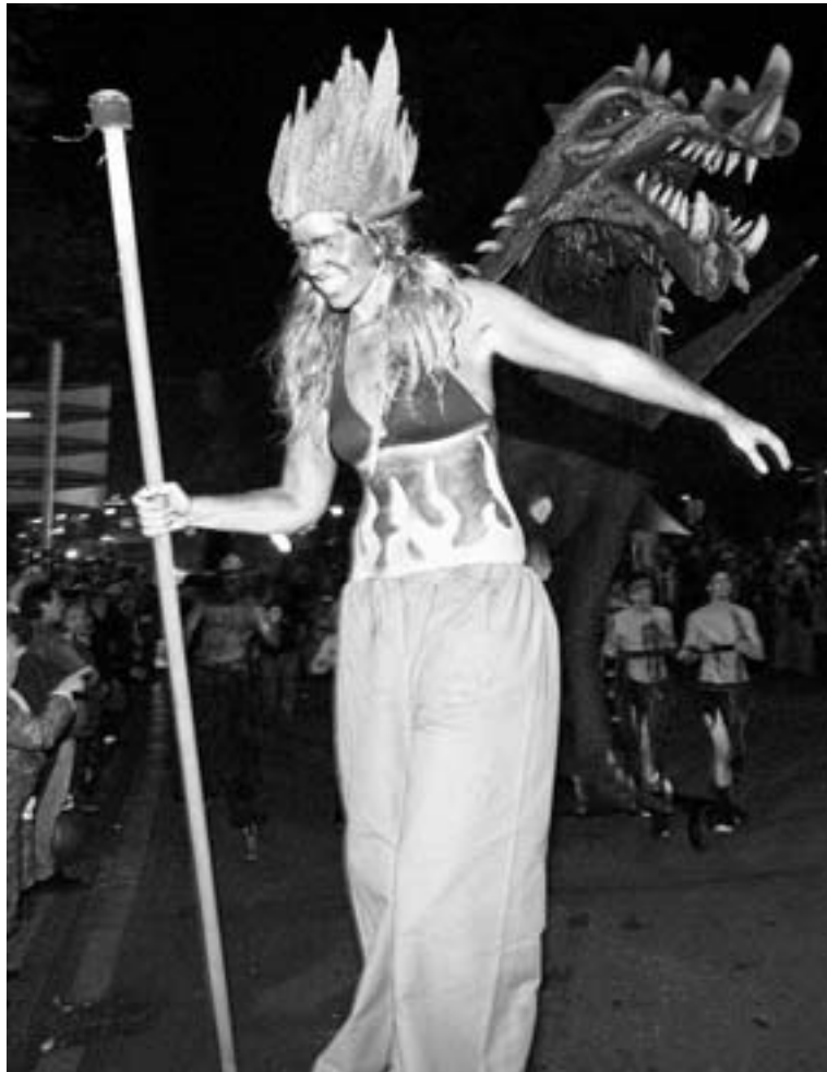
Desfile de San Jorge del pasado año.

El programa también incluye el viernes, 29 de abril, un gran cocido popular (dos euros plato y cerveza) que se celebra por tercer año consecutivo para dar más contenido a