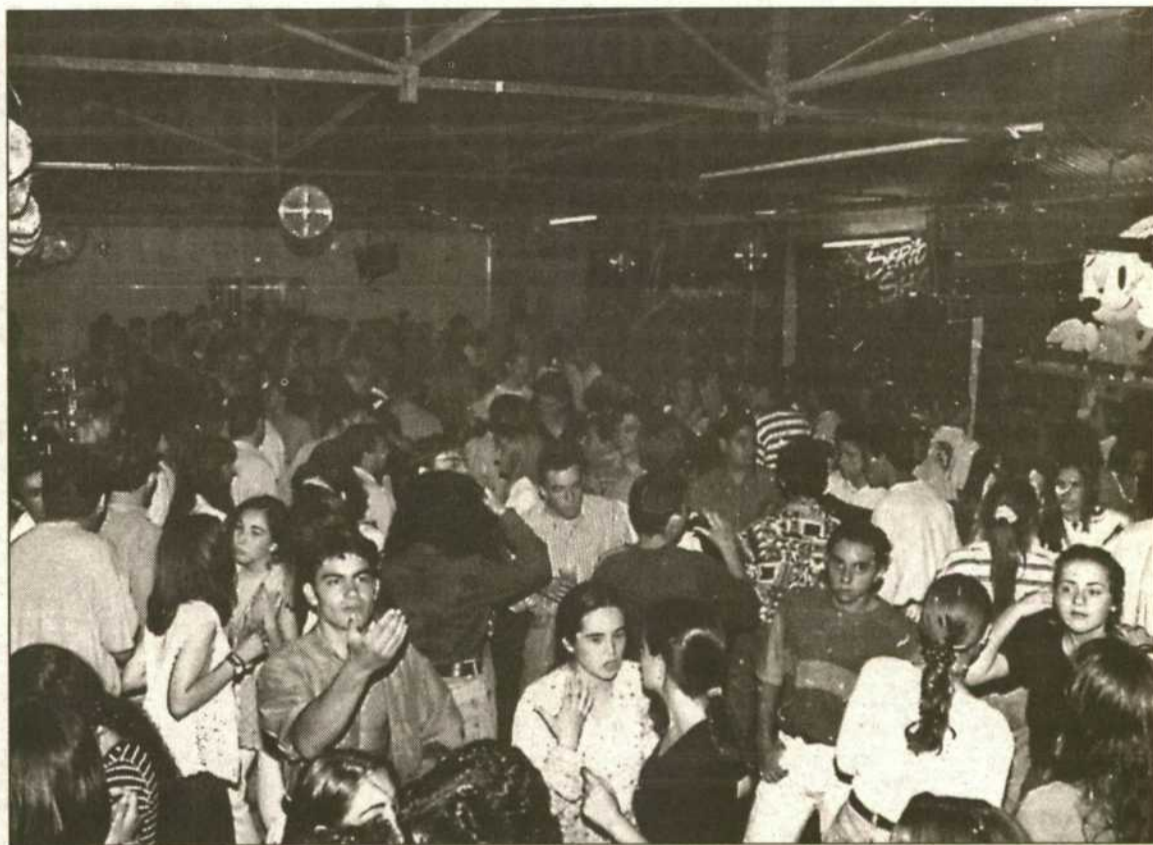
La aglomeración en las casetas en la madrugada del sábado fue impresionante y se mantuvo al mismo hasta que llegó el día.

No solo, sino acompañado de su bella esposa, estuvo también en la feria el consejero delegado de Mosa (concesionaria de Peugeot), invitado por el director de la sucursal de Badajoz y su mujer. El directivo, que en los minutos iniciales estuvo algo cohibido, se lanzaría después al ruedo y se marcaría unas rumbas tratando de no desentonar ante el salero