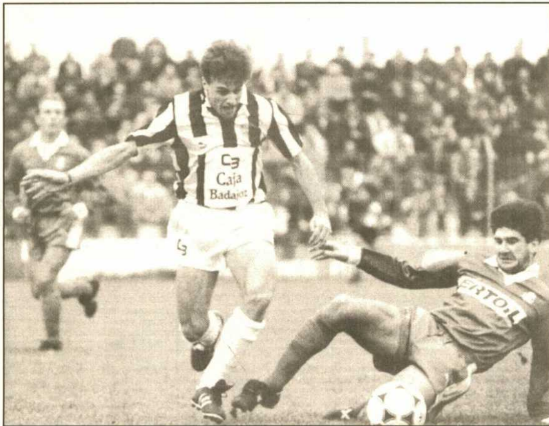
El blanquinegro Izquierdo, que fue uno de los destacados, supera a Quico.

Al maestro le gustaría que esta pieza distinguida con el Premio Constitución fuese estrenada por el Coro del Conservatorio de Badajoz. PAGINA 4