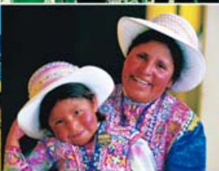
Valle del Colca, Arequipa