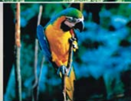
Guacamayo, Madre de Dios