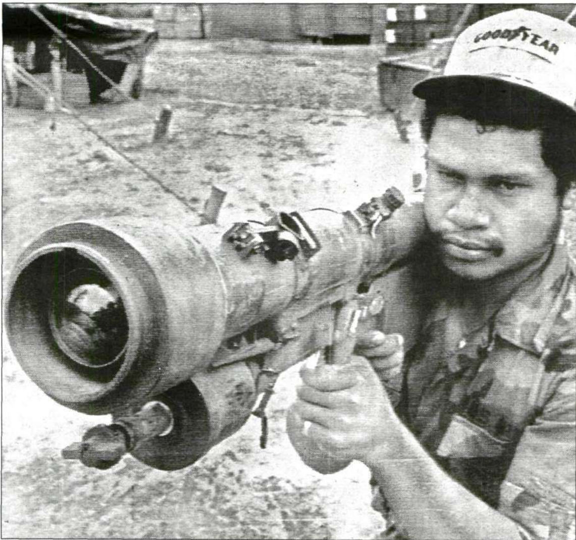
El misil antiaéreo del modelo 'Sam 7 Strela' es un arma fabricada en los años sesenta por los países del Pacto de Varsovia. Es portátil y se dispara desde el hombro porque no necesita ninguna estructura para ser utilizado.

Las Fuerzas de Seguridad creen que el aparato etarra de cursillos tenía datos sobre los dos 'Sam 7'