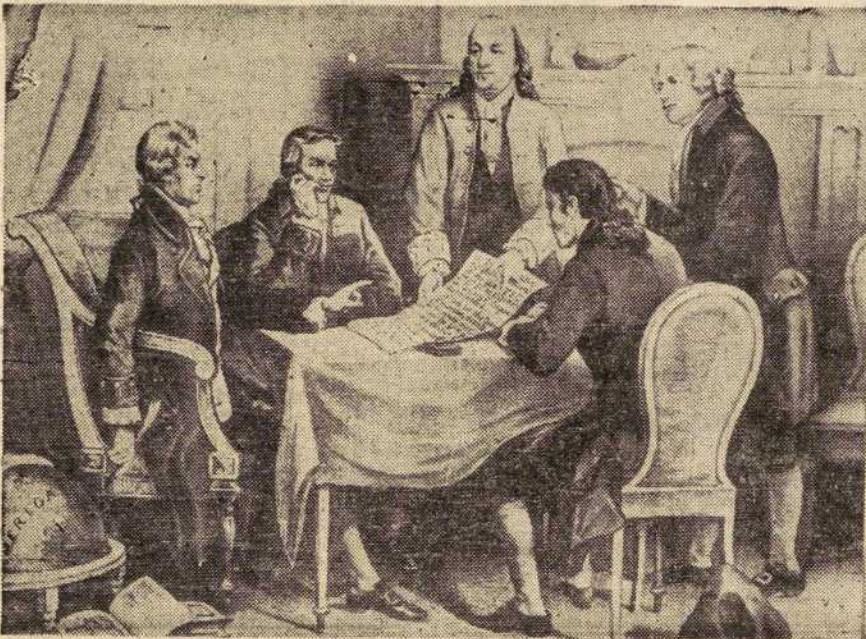
Grabado que representa al Comité repasando el borrador de la declaración de la independencia que Jefferson había preparado.

George Washington llegaba a la Presidencia, la primera en la historia de los Estados Unidos, aupado por su tremenda popularidad adquirida en los campos de batalla, y como "hijo de los habitantes de la nueva nación, desgajada del Imperio británico. Aquellas colonias, cuya población apenas alcanzaba los cuatro millones, en su mayor parte agricultores, acababan de alcanzar la sagrada independencia después de muchas zozobras, y ahora se