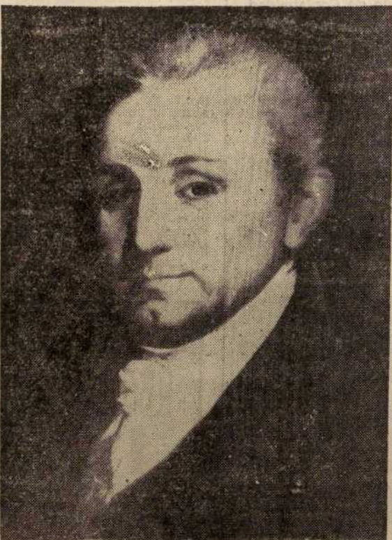
James Monroe, quinto presidente de los Estados Unidos, fue elegido en 1817 y reelegido para un segundo mandato.

en 1751. Sus ocho años en la Casa Blanca transcurrieron entre graves disensiones en las que llegó incluso al mismo borde de la secesión. En política exterior se registró la declara-