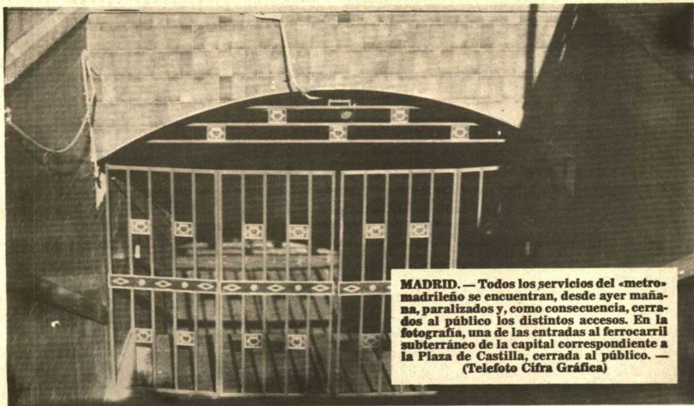
MADRID. — Todos los servicios del «metro» madrileño se encuentran, desde ayer mañana, paralizados y, como consecuencia, cerrados al público los distintos accesos. En la fotografía, una de las entradas al ferrocarril subterráneo de la capital correspondiente a la Plaza de Castilla, cerrada al público.