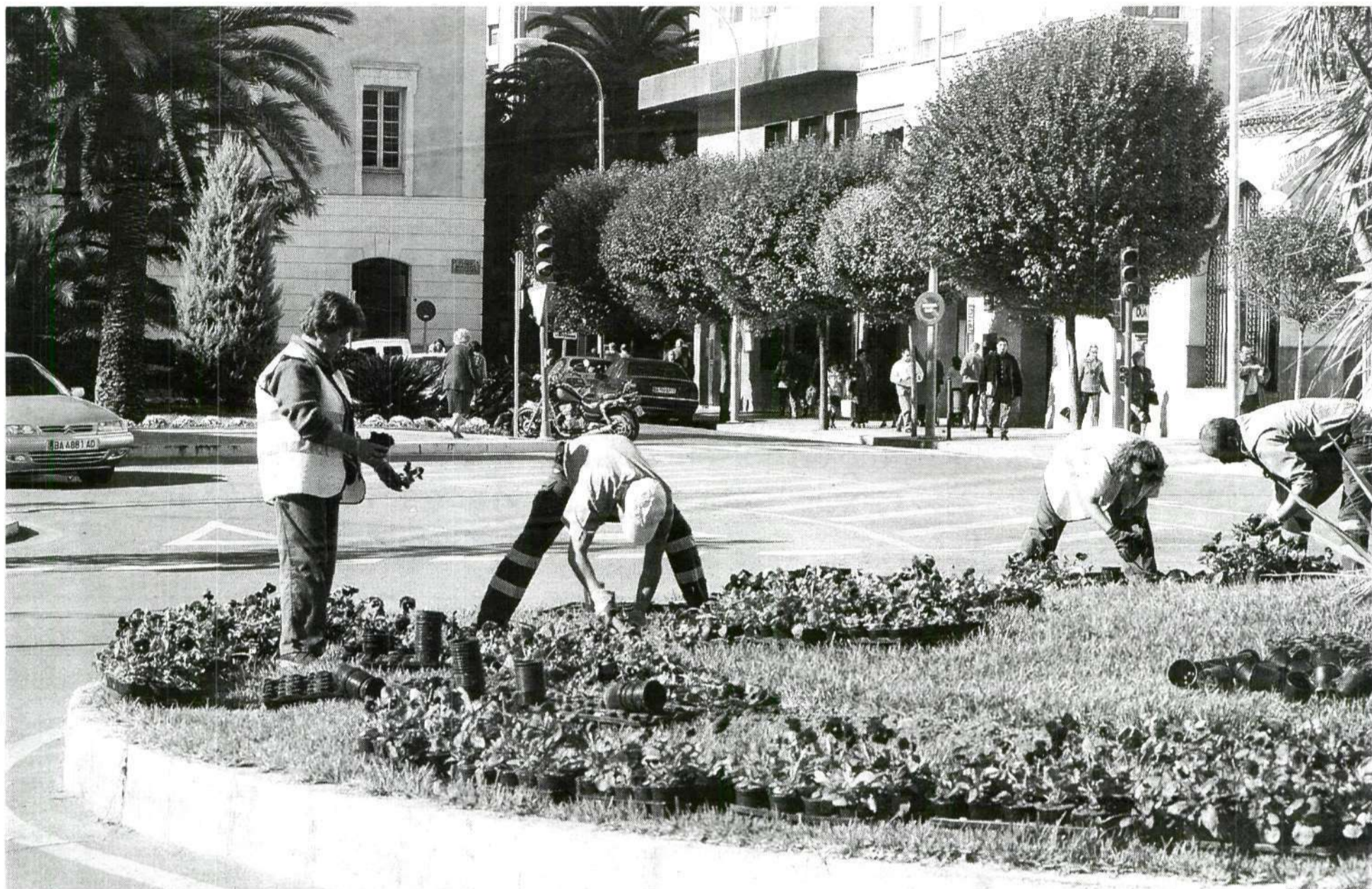
EN BENEFICIO DE LA COMUNIDAD. La mayoría de los jóvenes delincuentes redimen pena por horas en régimen abierto, ya sea formándose o trabajando para la sociedad.