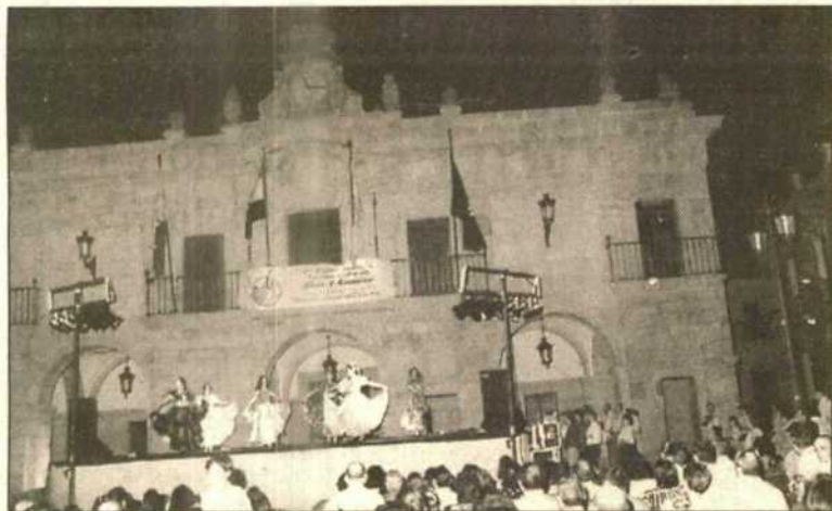
Imagen de una celebración de este Verano Cultural.