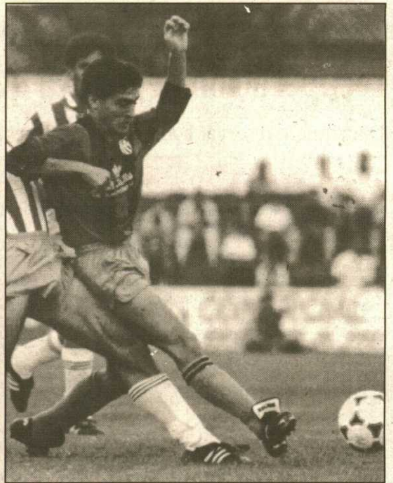
Cortés desempeñará en el centro del campo las labores de volante por la misma banda donde se alineaba en la defensa. (BRIGIDO).

Amador estará en la puerta, desbancando así al que hasta la pasada jornada fue guardameta titular, Diezma. Ortiz y Cerdán estarán en los laterales, ocupando el centro de la defensa Félix y Bernad. En el centro del campo se impone la recomposición de líneas, ya que el lateral derecho, Cortés, desempeñará las funciones de volante por la misma banda donde se alineaba como defensa; Soler y Juani o V. Cruz lo harán por la izquierda, siendo Paniagua y Márquez los hombres encargados de crear peligro desde la zona constructiva de los de Almendralejo. En el ataque, Luis de León y Gabi completarán el once azulgrana.