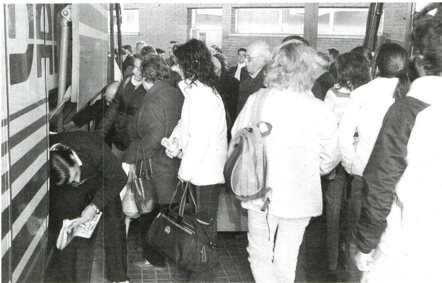
AGLOMERACIONES. Alrededor de 6.000 personas se movieron ayer en la estación de autobuses de Badajoz.