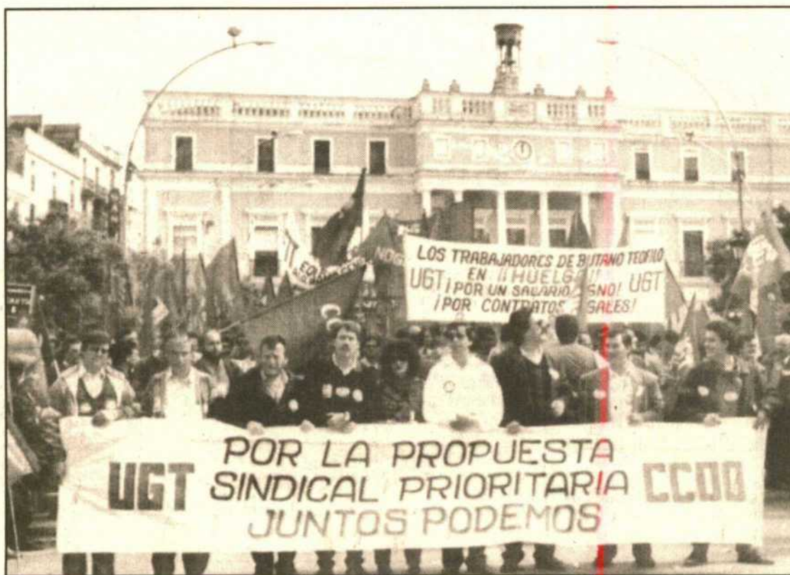
Cabeza de la manifestación celebrada ayer en Badajoz.