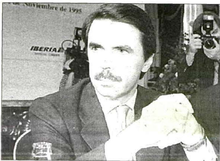
José María Aznar estará hoy en Cáceres.

Según fuentes del PP, se espera la asistencia al acto de unas 8.000 personas.