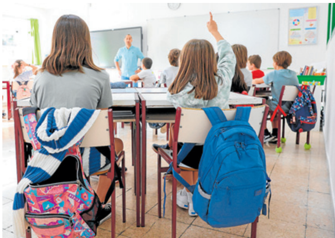
Imagen de archivo de un aula en un centro educativo. HOY

De hecho, Extremadura está entre las comunidades autónomas que han experimentado un mayor incremento de alumnado extranjero respecto al curso pasado, solo por detrás de Castilla y León (un 17,5% más) y Asturias (14,6%). La subida de la media nacional es del 4,5% y solo