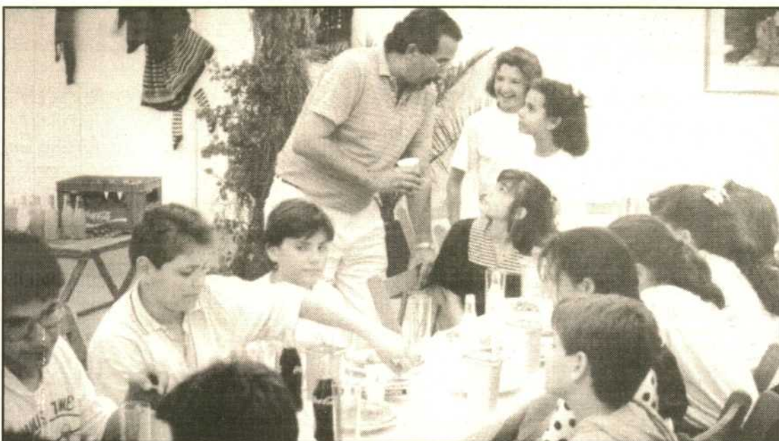
El alcalde debió hacer ayer doblete en la Feria, comiendo al mismo tiempo con la Corporación infantil y con representantes de comparsas de carnaval. Los jóvenes de la Corporación infantil —en la foto, con el alcalde— se lo pasaron en grande

y disponer además de la oportunidad de llevarse a casa, junto al gazpacho, un balón de fútbol de reglamento firmado por todos los componentes de la Selección italiana de fútbol. El balón tiene las firmas de los Zenga, Gianluca Vialli, Mancini, Carnevale, Tacconi, Bergomi, Ferri, Baresi y el largo etcétera de esta "squadra", lo que sin duda es un recuerdo imborrable tanto para los aficionados al fútbol como para los pasen de él, que podrán optar por darle patadas si lo desean. HOY ha conseguido este balón merced al patrocinio del concurso de preguntas que en su día publicamos. Ya que los muchachos de la selección española debieron venir a casa con las manos vacías, puede quedarle al ganador del balón el consuelo de saber que los italianos —sin tifossi de por medio, en la soledad de la concentración— han depositado sus firmas en un balón que se quedará en tierras extremeñas. A la entrada al recinto del ferial cada asistente recibirá gratuitamente por lo menos una papeleta. Pero no lleguen mucho después de las 13 horas, porque las papeletas se nos pueden acabar. Y si tras desgustar el gazpacho les quedan ganas, podrán pasear por el recinto ferial y hacerse con uno de esos afamados globos llenos de arroz, tan divertidos después en casa cuando los niños se ponen a jugar con ellos en casa. O con un perro gigante o con una vaca loca, que también las hay en la feria, para que como dice la copla "no falte de ná".