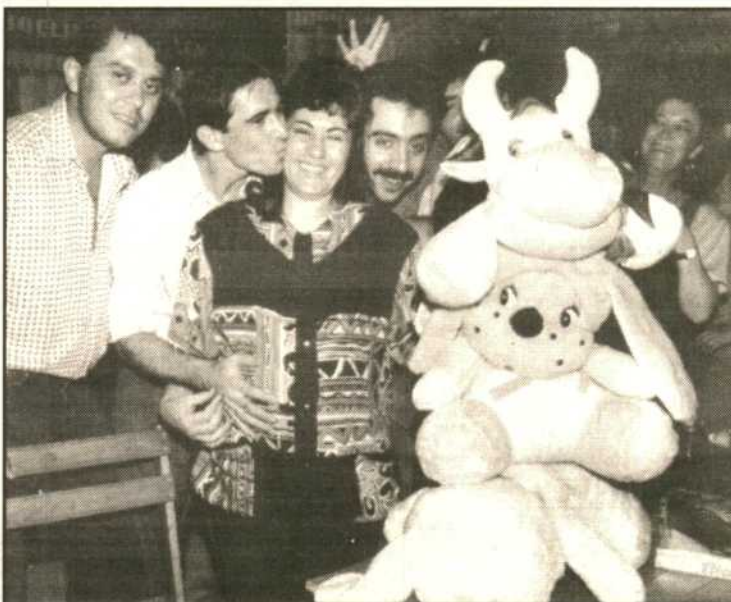
Eso se llama guardar para el futuro. La señora, embarazada, se llevaba a casa una vaca loca gigante, un peluche y muchas cosas más... además del niño que llegará y que ya tiene juguetes esperándole (SANTY).