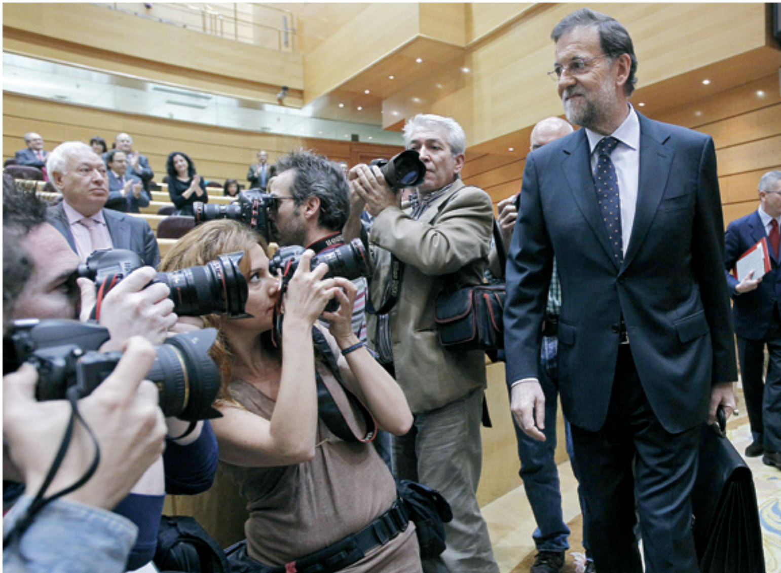
Mariano Rajoy se dirige a su escaño en el Senado para participar en la sesión de control al Gobierno de ayer.