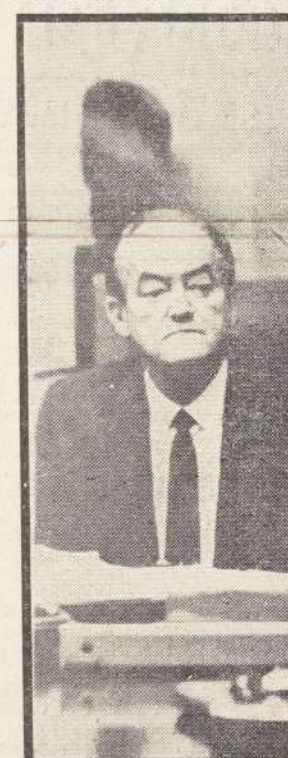
27 de marzo de 1968: Johnson y el vicepresidente Humphrey discuten el próximo cese de bombardeos con el general Creighton Abrams, comandante en jefe en el Vietnam.

La mayoría de la gente olvidaba, o ignoraba, este hecho básico: habíamos interrumpido los bombardeos, no una o dos veces, sino en ocho ocasiones diferentes desde 1965 hasta comienzos de 1968. Habíamos de-