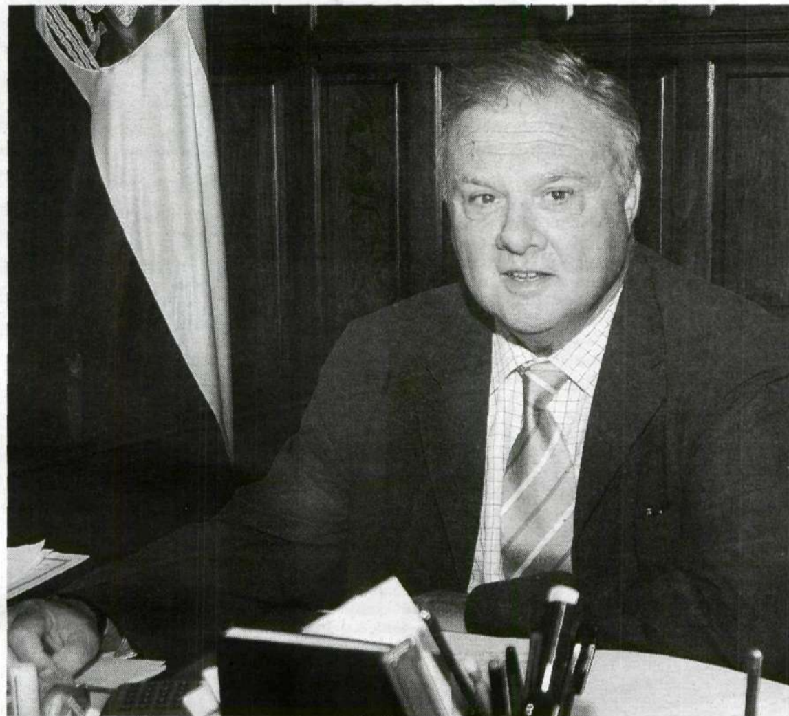
Miguel Ángel Celdrán, en la toma de posesión como alcalde de Badajoz celebrada el pasado sábado.

—Se han puesto primero las atracciones, lo que hace que el paso no sea obligado pero que prácticamente es recomendable pasar por ellas primero, después por las casetas de tiro, sorteo y ventas y por último las casetas de las sociedades. Eso es lo que se ha hecho, con arreglo a otros años. Además, se va completando la Feria, si mal no recuerdo se han echado unas manos de asfaltado, se han plantado árboles y se han modificado algunos centros de transformación. Esperamos seguir completando el Real de la feria el año que viene para ir consolidándola.