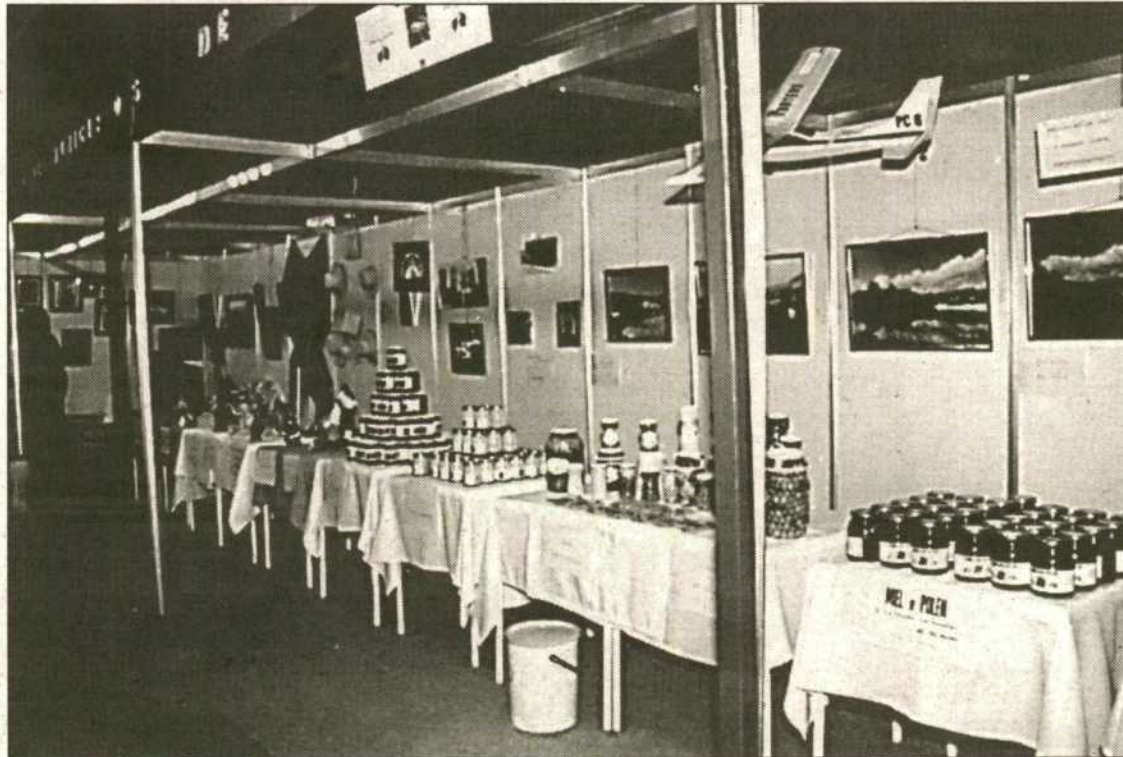
Las Hurdes se encuentra en Ifenor presentando todas sus maravillas artesanales y naturales.

La comarca de Las Hurdes está situada en el extremo norte de la provincia de Cáceres, entre la Sierra de Gata y el río Alagón. Son 470 kilómetros cuadrados los que encierran esta comarca auténticamente ibérica por su antigüedad y extremeña por su idiosincrasia forjada a golpes como sus hermanos del sur. El paisaje es uno de los más definidos que tiene la región extremeña: jaras y enebros, tejos y lentiscos, brezo y madroñera, escarpadas hondonadas, arroyuelos, riachuelos que serpentean entre cantábricos pizarrales, villorrios de piedra y luto...no en vano,