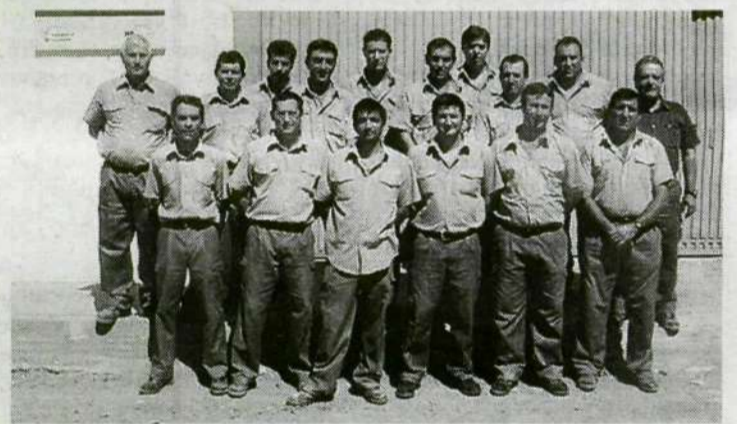
ALUMNOS. El alumnado, con sus monitores.