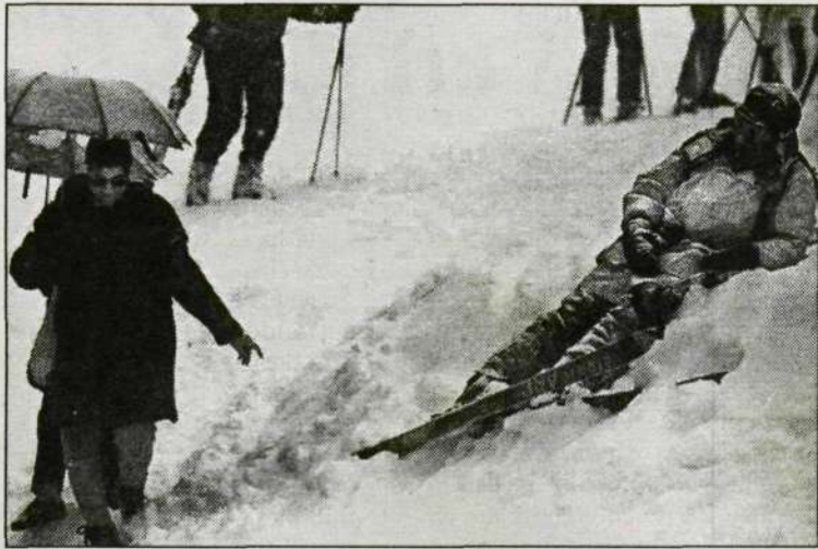
Un esquiador espera tumbado sobre la nieve la decisión de los jueces sobre la suspensión de los entrenamientos durante la jornada de ayer.

La impresionante nevada de las últimas horas impidió que la