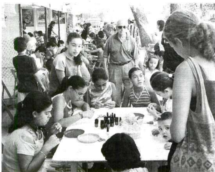
TALLERES. Chicos y chicas en Castelar este verano.