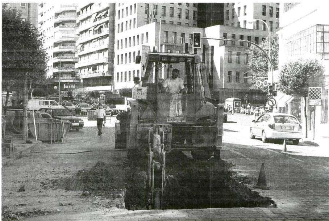
OBRAS. El agujero abierto en la calle Pedro Valdivia dificulta el tránsito de vehículos.

Nº Autorización Administrativa: 790123/97. Dirección General de Trabajo