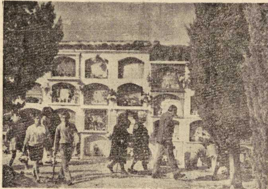
Un aspecto del cementerio de la capital.

--Muy bien. No me da ningún miedo. Juego entre las tumbas. De noche salgo a buscar a mi abuelito para llamarlo a cenar.