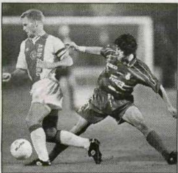
Retransmisión del encuentro entre Boavista y Oporto. C-1. 20,45