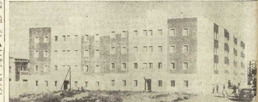
Grupo de viviendas del Ministerio, que fueron inauguradas ayer con asistencia de las autoridades.