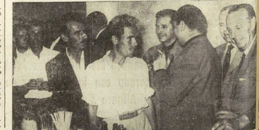
El gobernador civil, señor Santolalla, departiendo con obreros de la construcción en un grupo de viviendas inauguradas.