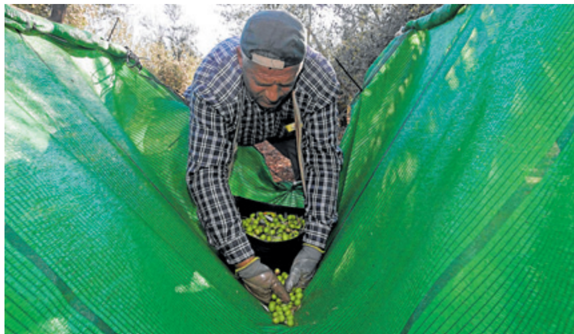
La aceituna verde española tiene un arancel del 15% en Estados Unidos; la negra asume el 46%. J. M. ROMERO

Según Asemesa (la Asociación de Exportadores e Industriales de Aceitunas de Mesa), esa imposición en 2018 hizo que España dejara de exportar por valor de 350 millones desde entonces y disminuyera su cuota de mercado del 70 al 30%. Ahora Zambrano